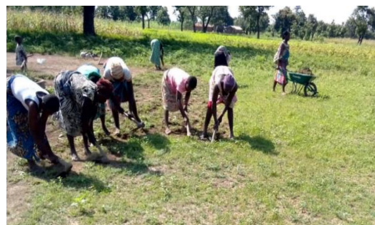
Séance de salubrité publique dans une des localités bénéficiaires