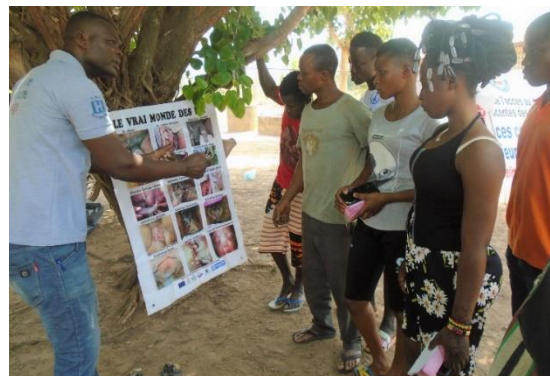
Sensibilisation des jeunes à Mô

Les résultats obtenus se présentent comme suit :