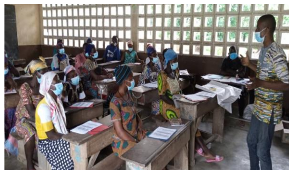
Les mères leaders en formation