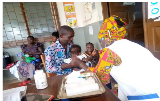
Un papa champion ayant amené son enfant pour la vaccination au CMS Bon-Secours

Ainsi, l'ONG ADESCO à travers les PAPAS CHAMPIONS et en collaboration avec les Responsables des Formations Sanitaires (RFS) a planifié et réalisé des activités d'identification et de recherche de perdu de vu et de la mobilisation communautaires à travers les sensibilisations, les causeries, les Visites à Domicile (VAD) et les entretiens individuels.