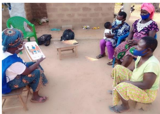
Séance de visite à domicile avec une ASC

Le projet est mis en œuvre en partenariat avec les ONG Regroupement des Associations pour le Développement Appliqué des Ruraux (RADAR) et Appui au Développement de la Santé Communautaire (ADESCO), avec la participation des services techniques de l'Etat et des communautés des deux préfectures bénéficiaires.