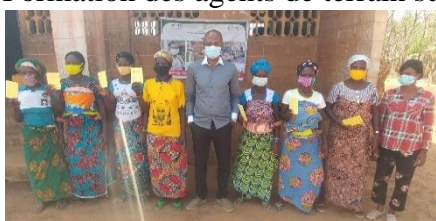
Photo de famille des femmes cantinières et du DE ADESCO lors de visite de terrain à Dankpen