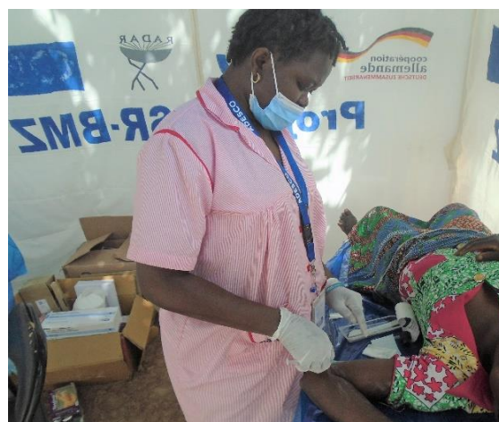
Adoption d'une méthode contraceptive par une cliente

Les méthodes contraceptives et protection offertes par ADESCO à travers la stratégie fixe et mobiles sont consignées dans le tableau ci-dessous :