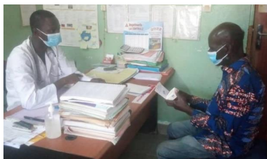
Un patient reçu en consultation