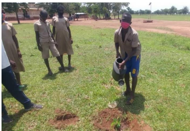
Action du reboisement dans x école

En appui aux actions sur le plan national dans la lutte contre les changements climatiques, l'ONG ADESCO en partenariat avec la direction préfectorale de l'environnement de Dankpen et les communautés a mise à terre 100 plans dans 10 écoles à cantines à savoir : au cours de l'année 2021.