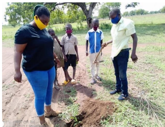
Action du reboisement dans X école avec l'appui d'une Animatrice d'ADESCO