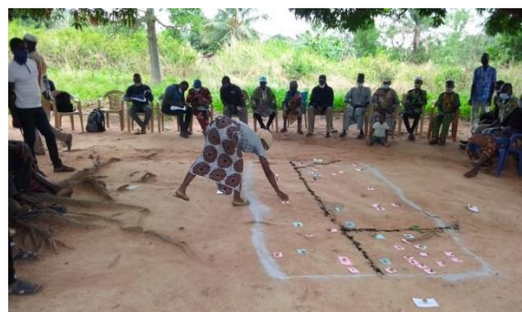
Déclenchement communautaire dans une des localités

En dépit des différents efforts fournis par l'Etat et ses partenaires en développement, le niveau d'accomplissement du droit à la santé reste dans l'ensemble faible par rapport aux normes et standards internationaux. En conséquence il y a beaucoup de cas de maladies hydro fécales, les maladies de la peau, les envenimations et les cas soupçonnés de MTN à manifestations cutanées. Le recours aux tradithérapeutes et à l'automédication est courant dans la zone. Ainsi, avec l'appui financier de la Fondation Anesvad, ADESCO a pu réaliser au cours de l'année 2021 les activités suivantes :