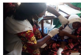
Vaccination d'un enfant