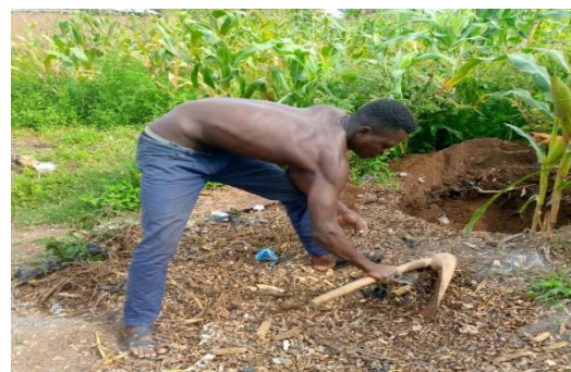
Réalisation d'une fosse pour dépôt des ordures