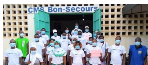
Relais communautaires /ASC du CMS Bon-Secours outillés pour la campagne CPS